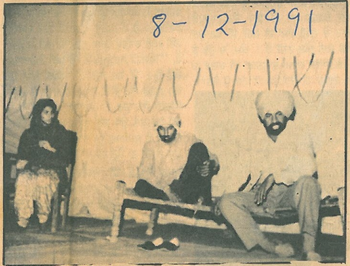
ਨਾਟਕ 'ਮੁਨਸ਼ੀ ਖਾਨ' ਦਾ ਇਕ ਦ੍ਰਿਸ਼