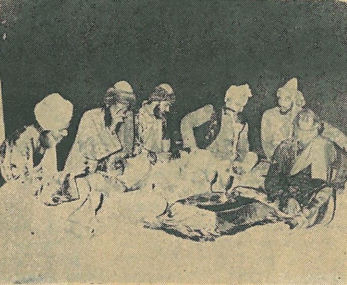
'ਤਖਤ ਲਾਹੌਰ ਦਾ' ਦਾ ਇਕ ਦ੍ਰਿਸ਼